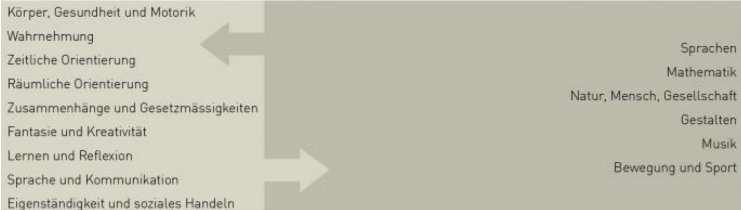
Abbildung 4: Entwicklungsorientierte Zugänge und Fachbereiche Lehrplan 21

Der Unterricht im 1. Zyklus orientiert sich allerdings stark an der Entwicklung der Kinder und wird vor allem zu Beginn fächerübergreifend organisiert und gestaltet.